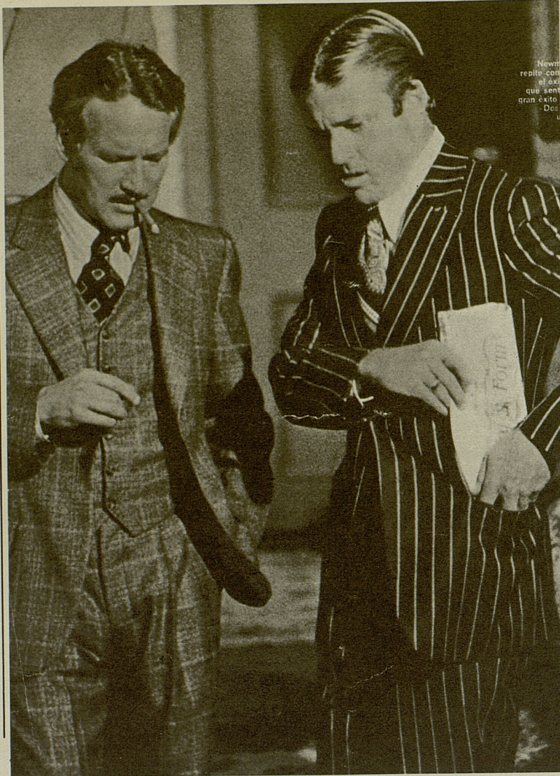
▲ "El golpe", un filme norteamericano de un "retro", con carga política más leve que la característica de la mayoría de filmes "retro" europeos.

El origen de las diferencias debe buscarse, sin duda, en los distintos marcos económicos que dan origen a ambos Retros : en efecto, la industria cinematográfica europea no se halla en el mismo estadio de concentración que la industria del cine USA; lo cual, ya de entrada, prefigura